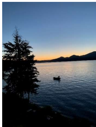
View of Lake Pend d'Oreille in Northern Idaho, where I was raised

Our Orthodox Christian theology views evil not as a primeval essence that is co-eternal and equal to God, but rather a falling away from good. Evil does not exist in and of itself, and was not created by God. Our Orthodox Church rejects the Gnostic teaching that the entirety of being is made up of two realms which have forever existed together: the kingdom of light, and