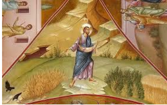
Христос – изађе сејач

и енергије упрослимо у циљу што бољег резултата. Наш однос према ономе што радимо може да много помогне. Ако волимо свој посао, без обзира шта радили, тај посао