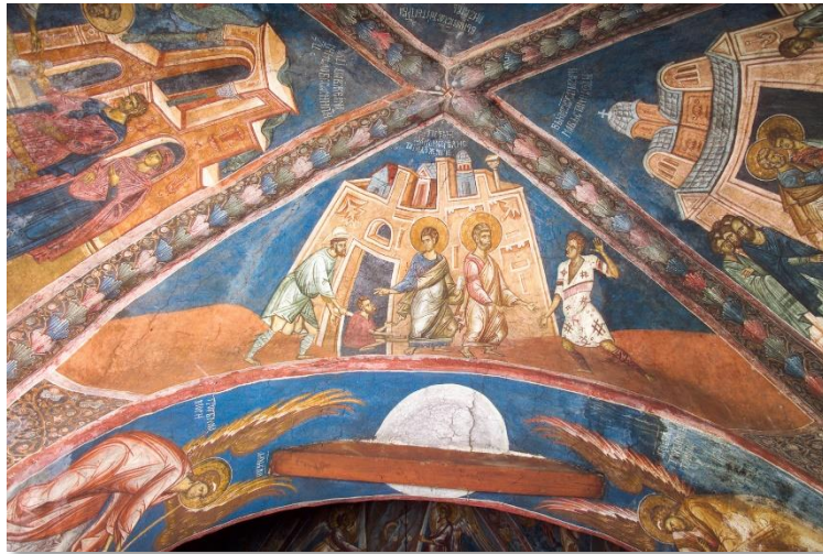
Апостоли Петар и Јован исцељују болесника, манастир Дечани

Историја Светих и богоносних отаца Цркве говори нам тако