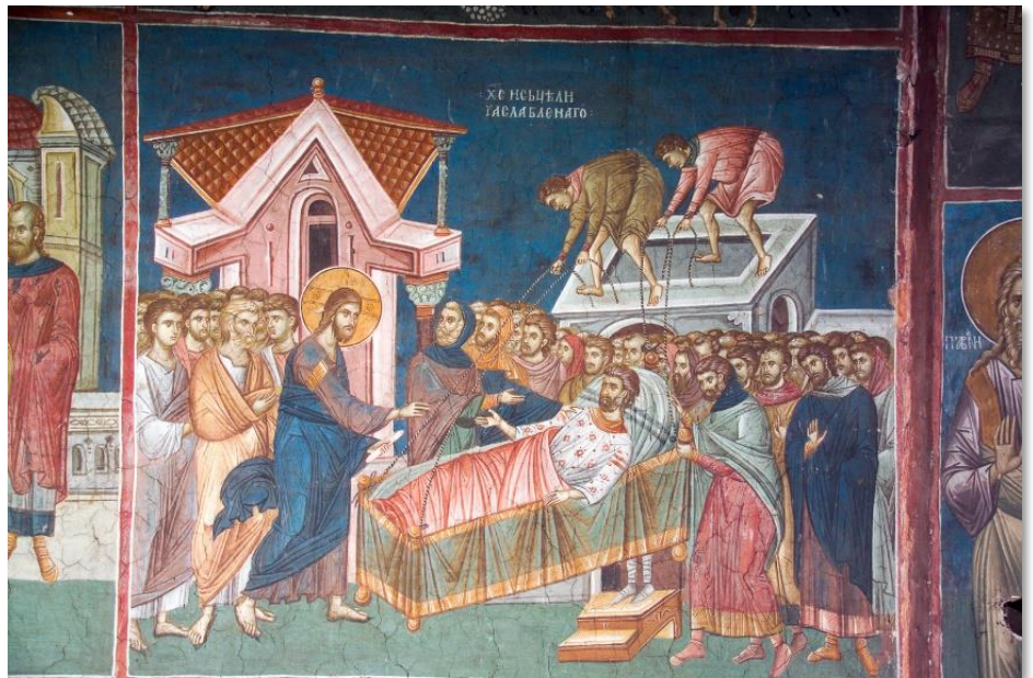
Христос исцељује раслабљеног, фреска у Дечанима

Н а трећу недељу после Васкрса у цркви се чита одељак из Јеванђеља по Јовану у коме се говори о томе како је Христос исцелио раслабљенога. Јеванђелист Јован пише: „Поштом беше празник јудејски, и изиђе Исус у Јерусалим. А у Јерусалиму код Овчијих врата постоји бања која се на јеврејском зове Витнезда, и има пет шремова. У њима лежаше велико мноштво болесника, слејих, хромих, сухих, који чекаху да се вода зашћаласа. Јер анђео Госјодњи повремено силажаше и узбуркаваше воду; и који би први ушао пошто се узбурка вода, оздравио би, ма од какве болести боловао. А онде беше неки човек који шридесет и осам година беше болестан. Каг Исус виде овога лежи, и разуме да је већ многа година болестан, рече му: Хоћеш ли да будеш здрав? Одговори му болесник: Да, Госјоде, немам човека да ме сјустји у бању када се узбурка вода; а док ја дођем, друји сиђе пре мене. Рече му Исус: Устани, узми одар свој и ходи. И одмах оздрави човек, и