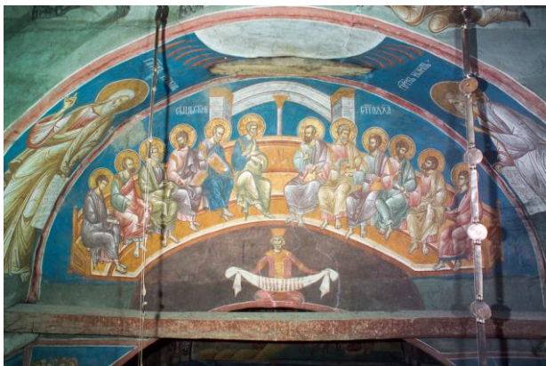
Силазак Св. Духа на Апостоле, ман. Дечани

Горње речи Господа Исуса Христа су се у потпуности обистиниле у педесети дан по Васкрсењу. То су пророчке речи Спаситеља света, а догађај који се десио на дан Педесетнице у свему је потврдио да се ово пророштво дословно испунило. Наиме, Отац је послао Духа Светога, Који је на упечатљив начин сишао на апостоле. Сишао је у виду пламених језика. То због тога да овај сусрет са Духом Светим осете и доживе сва чула њихова. Да никакве сумње не буде у то да ли је Дух Свети сишао или није. Апостоли су требали да се увере у Васкрсење Христово и доласак Духа Светога и да верују у то без трачка сумње. Јер, Христос, Који за себе каже да је Истина, узидео је себе у темеље Цркве своје и постао њена глава. „Ја сам .. Истина“ (Јн. 14,6).