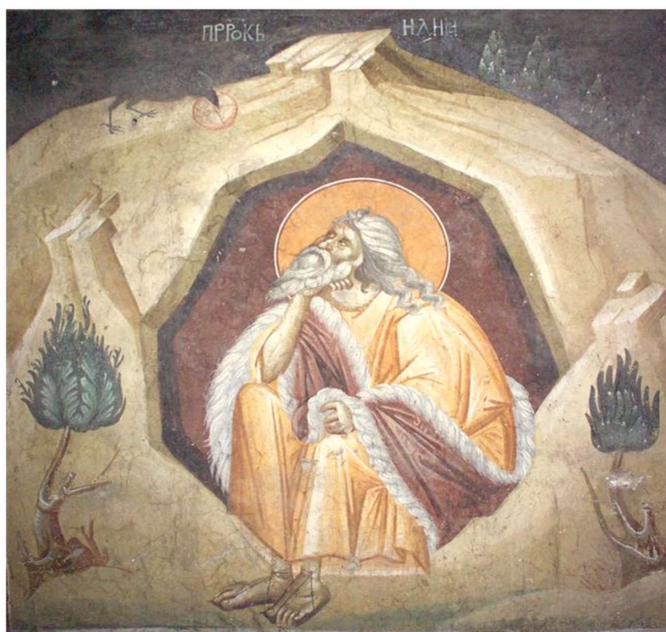
Свѣти Пророк Илија, фреска у манастиру Грачаница (14. век)

Б оговидац, чудотворац, ревнитељ вере Божје, св. Илија би родом од племена Аронова из града Тесвита, због чега је прозват Тесвићанин. Кад се Илија роди, отац његов Савах виде ангеле Божје око детета, како огњем дете повијају и пламен му дају да једе. То би предзнамење Илијиног пламеног карактера и његове богодане силе огњене. Сву младост своју провео је у богомислију и молитви, повлачећи се често у пустињу, да у тишини размишља и моли се. У то време царство јеврејско беше раздвојено на два неједнака дела: царство Јудино обухватајући само два племена, Јудино и Венијаминово, са престоницом у Јерусалиму, и царство Израилево обухватајући осталих 10 племена са престоницом у Самарији. Првим царством владаху потомци Соломонови, а другим потомци Јеровоама, слуге Соломонова. Највећи сукоб имаше пророк Илија са Израилским царем Ахавом и његовом опаком женом Језавељом. Јер они се клањаху идолима и одвртахау народ да служи Богу јединоме и живоме. При том још Језавеља као Сиријанка, наговори мужа те подиже храм Сиријскоме Богу