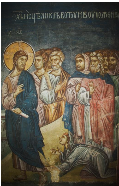
Исцељење крвошочиве жене, фреска манастира Дечани