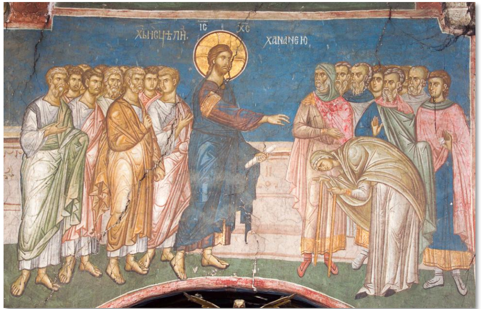
Исус исцелује зџрчену жену, фреска у манастиру Дечани

У данашњем светом јеванђелју имамо веома сликовит пример и човекољубља и самољубља. Господ Исус Христос, који је веома често улазио у храм и учествовао на заједничким молитвама, овом приликом, улазеђи у храм, видео је једну унесрећену жену, која беше згрчена. Осамнаест година се мучила ова жена и то необичном мучком. Према Светом Писму, Сатана је свезао ову жену, која од згрчености није могла да види ни лица