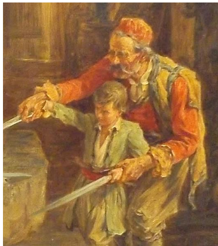
Мачевање (1884), гејшал слике Паје Јовановића

превазилази наше породичне кругове и простире се на рођаке, пријатеље и све наше познанике, и